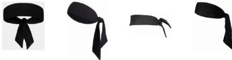
Διάγραμμα1. Παραδείγματα κορδελών κεφαλής τύπου φουλάρι

4-4 Κατάσταση. Το να φορούν (οι αθλητές) κορδέλες τύπου φουλάρι, δεν επιτρέπεται.