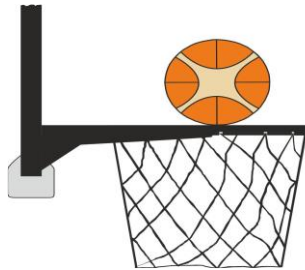
Διάγραμμα 2. Η μπάλα είναι σε επαφή με τη στεφάνη

31-19 Κατάσταση: Η παράβαση παρέμβασης (basket interference) σημειώνεται από έναν αμυνόμενο ή επιτιθέμενο παίκτη κατά τη διάρκεια μιας προσπάθειας για καλάθι όταν ένας παίκτης αγγίζει το καλάθι ή το ταμπλό ενώ η μπάλα είναι σε επαφή με τη στεφάνη και έχει ακόμα τη δυνατότητα να εισέλθει στο καλάθι.